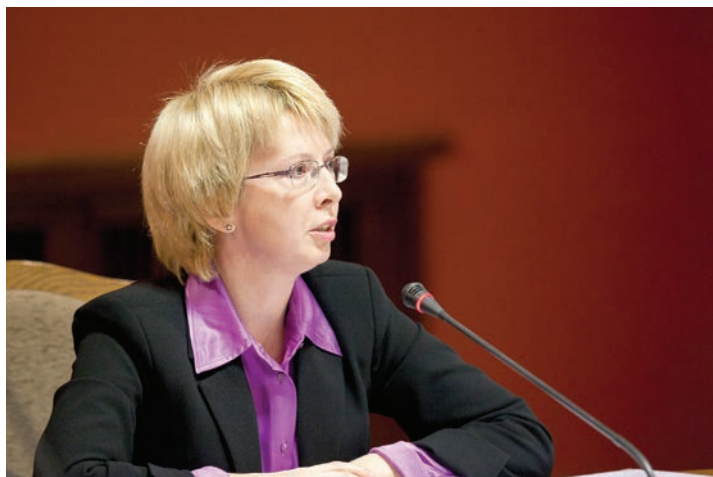
Saeimas Cilvēktiesību un sabiedrisko lietu komisijas vadītāja Ināra Mūrniece.

Tieslietu ministrija veikusi nozīmīgu darbu, uzlabojot grozījumus Pilsonības likumā, lai beidzot tiktu atrisināts ārvalstīs dzīvojošajiem latvie-