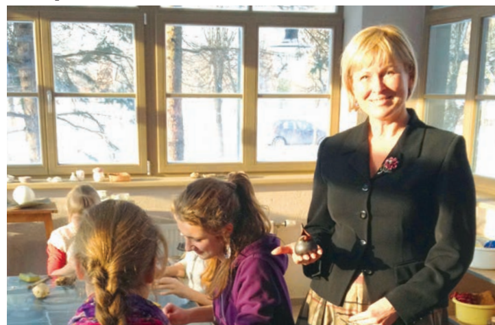
27. janvāri reģionālās vizītes ietvaros kultūras ministre viesojas Kultūras un humanitāro zinību vidusskolā.

Saeimas Eiropas lietu komisijā pēc NA deputātu iebildumiem