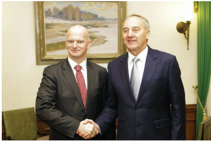
22.decembris 2011. Tieslietu ministra tikšanās ar Latvijas Valsts prezidentu jautājumā par demokrātiju un tiesiskumu referenduma rīkošanu. Sarunā tieslietu ministrs uzsvēra valsts pamatu negrozāmību.

Saeima beidzot pieņēmusi NA jau 10. Saeimā sniegto iniciatīvu lielāko daļu amatpersonu vēlēšanās balsojumā, tādējādi mazinot politisko tirgu par amatiem un novēršot situāciju, kad deputāti publiski atbalsta vienu kandidatūru, bet aizklāti nobalso par citu.